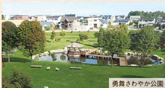
勇舞さわやか公園